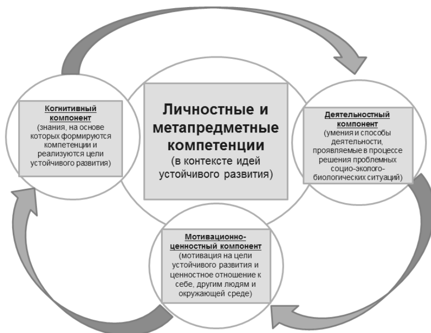
Рисунок 1 – Структурные компоненты личностных и метапредметных компетенций учащихся (в контексте идей устойчивого развития)

Каждый из критериев раскрывается посредством системы эмпирических показателей, отражающих степень сформированности отдельно взятого компонента. В качестве показателей выступают знания, умения, способности, мотивы, качества, отношения, ценности, потребности, опыт деятельности.